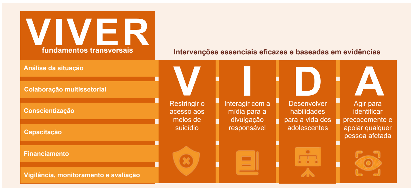
Figura 1 – Fundamentos transversais do VIVER A VIDA e intervenções essenciais eficazes baseadas em evidências